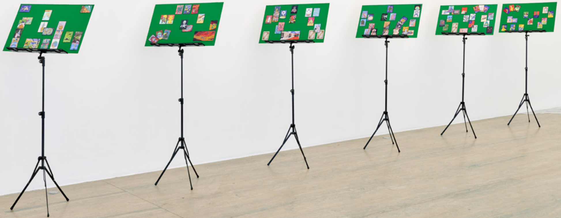
Mulligan : 38x60cm, cartes aimantées sur plaques de feutres, posées sur lutrin. Espace Halle Nord Genève. 2019