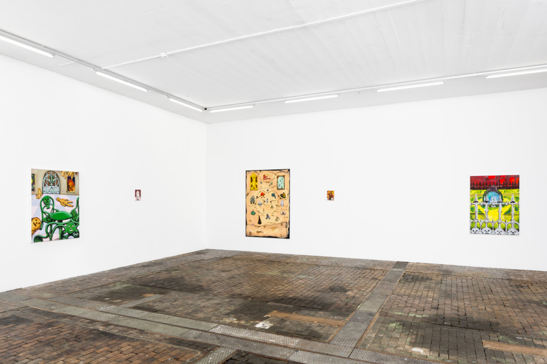
Bourse de la ville de Genève, Centre d'art contemporain de Genève. 2020