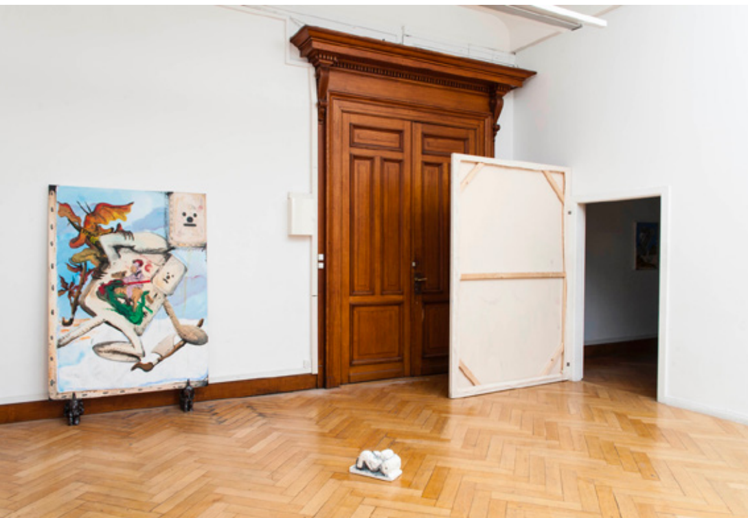
Entrée du monde de peinture (ouverture). 2018