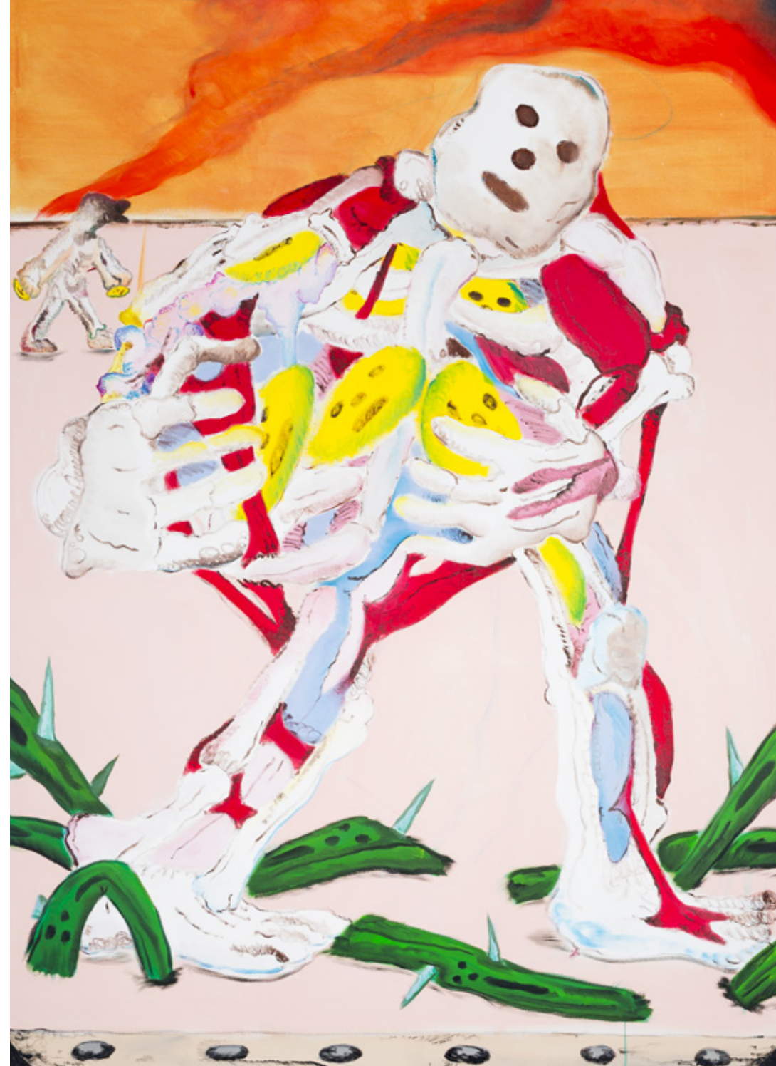
Assimilation du squelette : 180x130cm, acrylique et huile. 2019