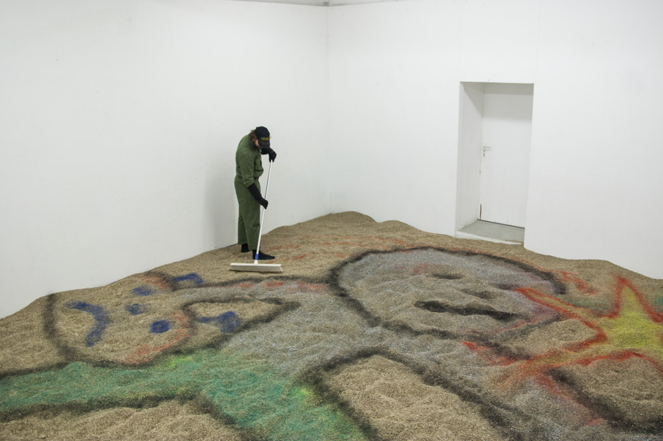
Plage d'accueil: 10m 2 , vermiculite et aérosol. 2018