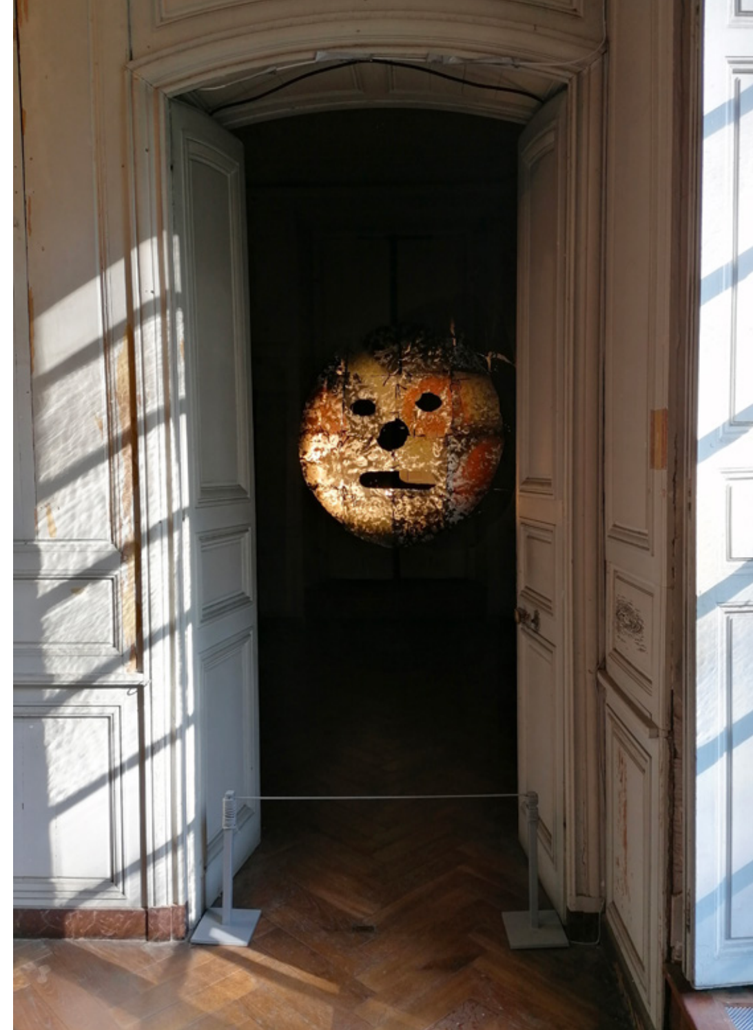
Girouette : 200x200cm, Tôles et aérosols. Château de Jossigny, France. 2021