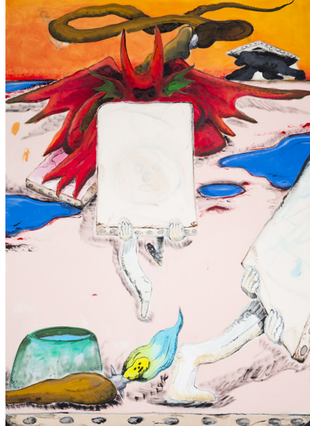
Contre coup brutal : 180x130cm acrylique et huile. 2019