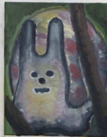
Profitons du humus : Formats divers, huile et tôles découpées. 2021