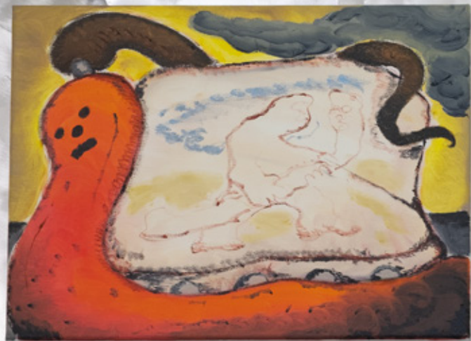
Profitons du humus : Formats divers, huile et tôles découpées. 2021