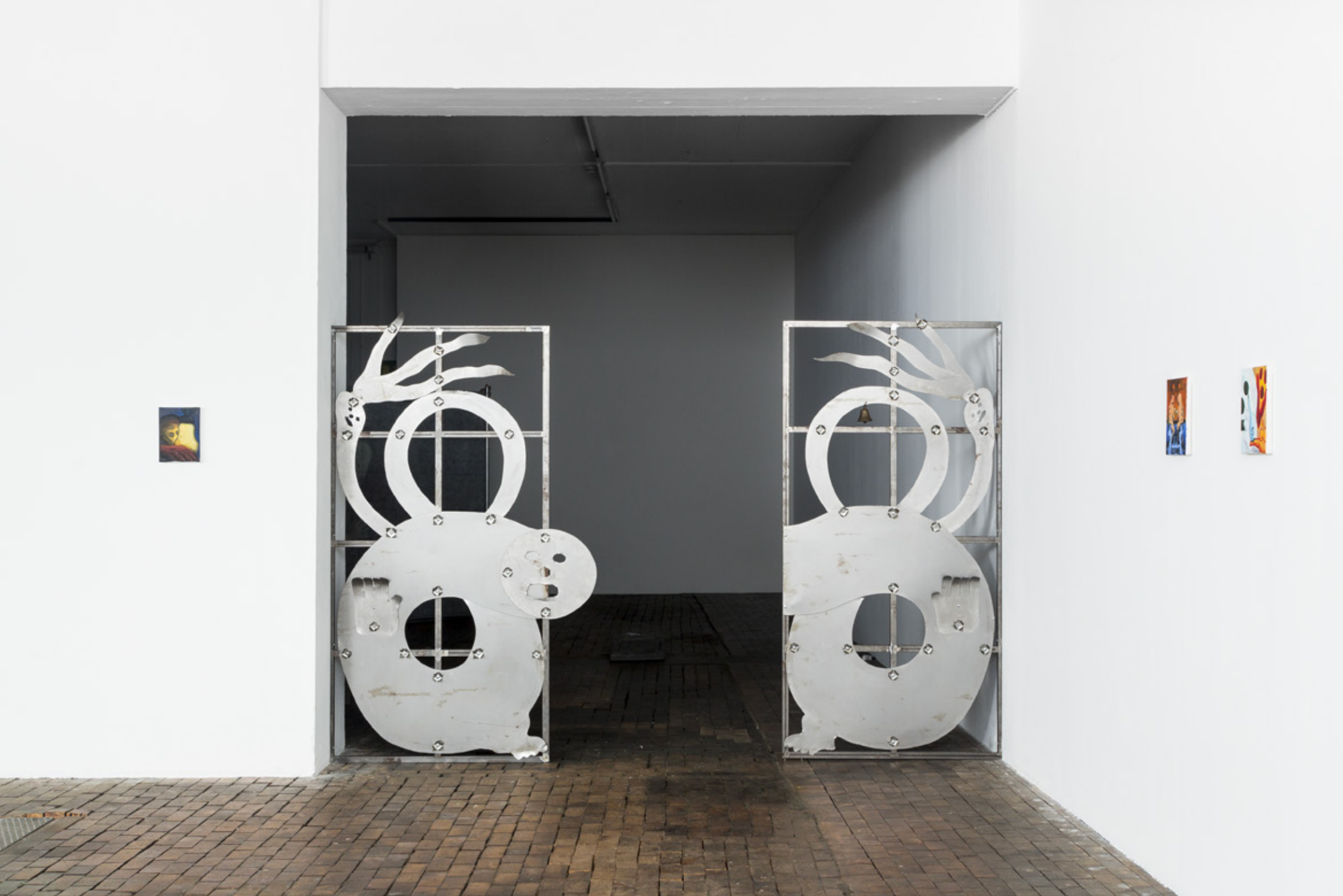
Peinture solide d'acier : 200x200cm, Acier. 2020 • Bourse de la ville de Genève, Centre d'art contemporain de Genève. 2020