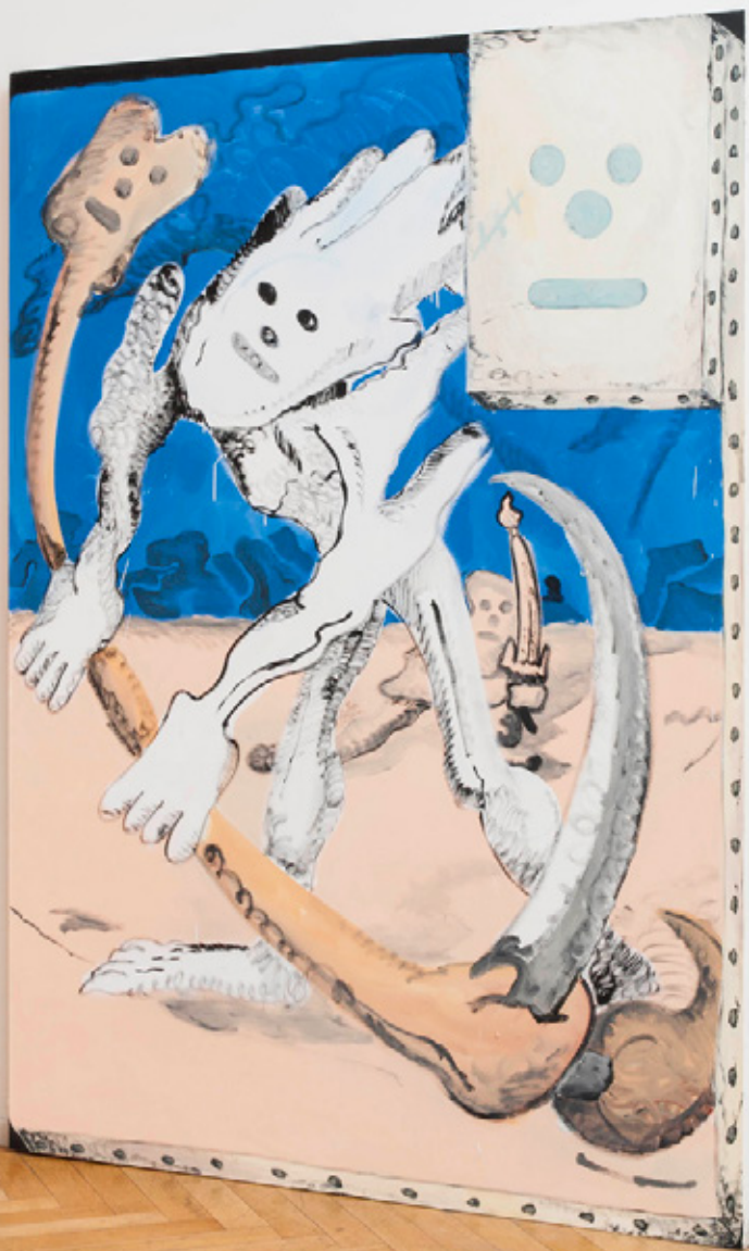
Entrée du monde de peinture : 240x150cm, acrylique et huile. 2018