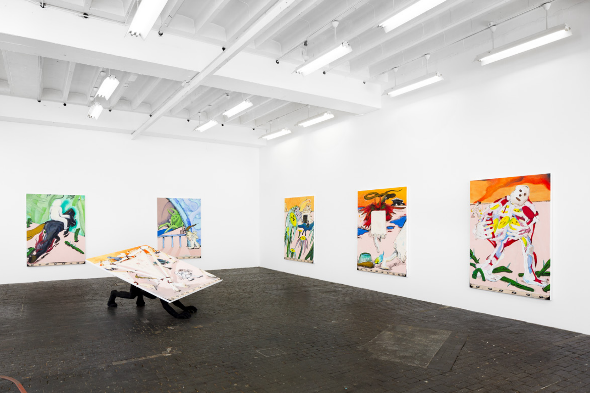
Bourse de la ville de Genève, Centre d'art contemporain de Genève. 2019