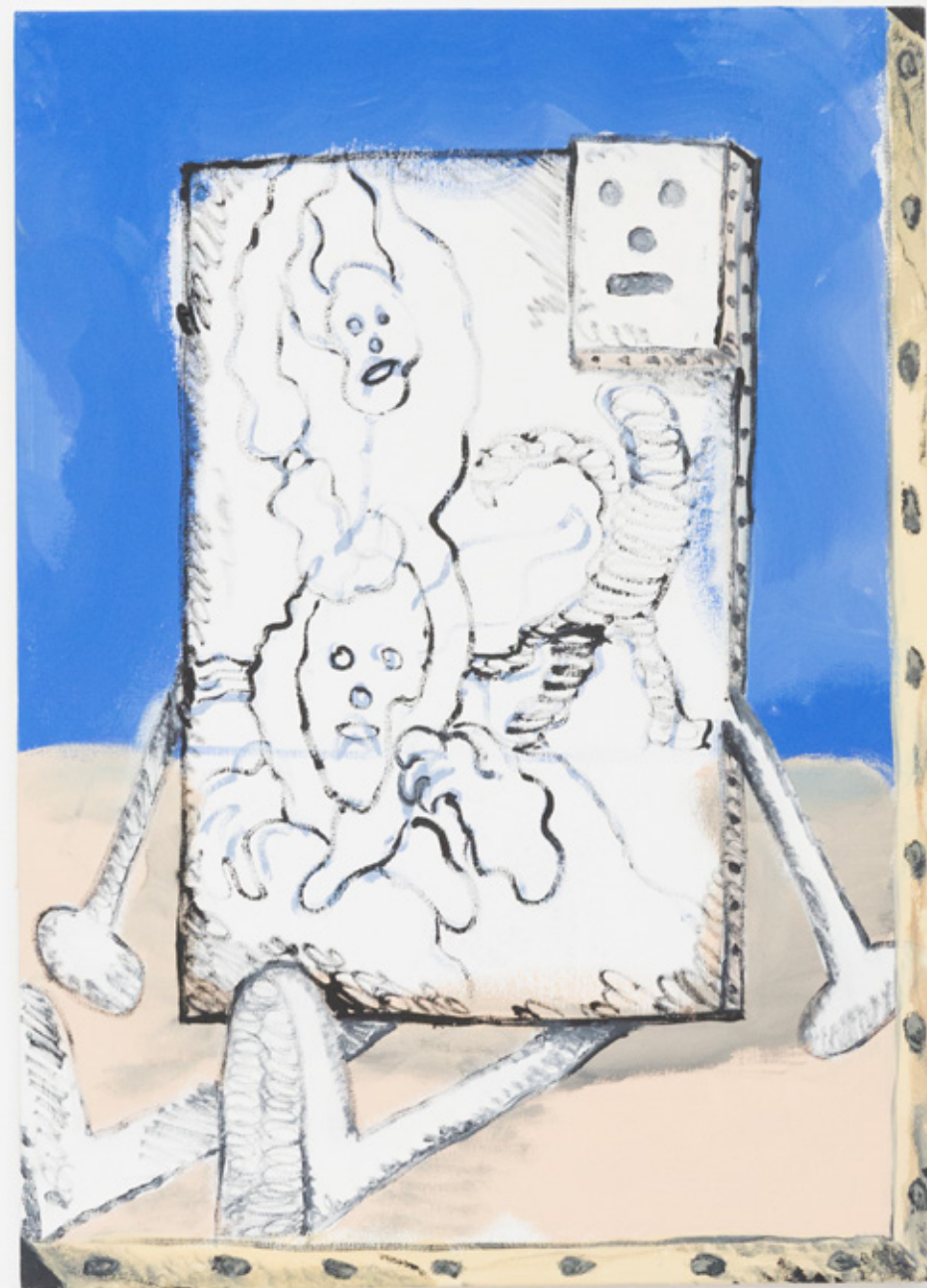
Tout à droite du monde de peinture: 80x50cm, acrylique et huile. 2018