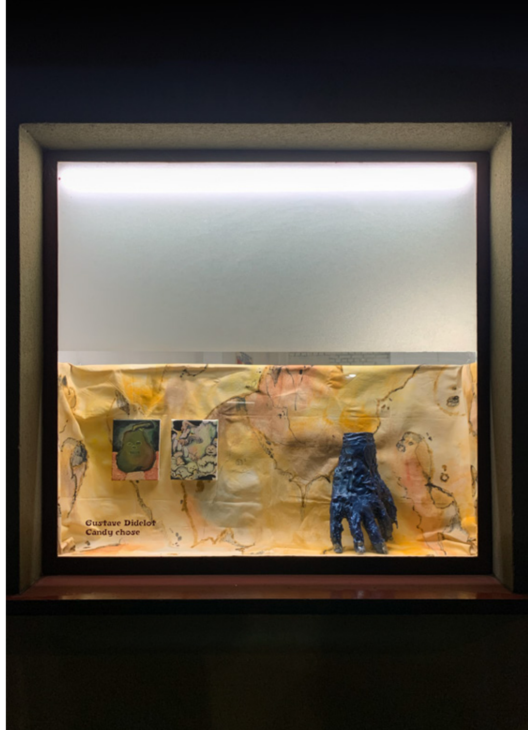
Candy Chose : Céramique et toile. Flamme Atelier, Paris. 2021