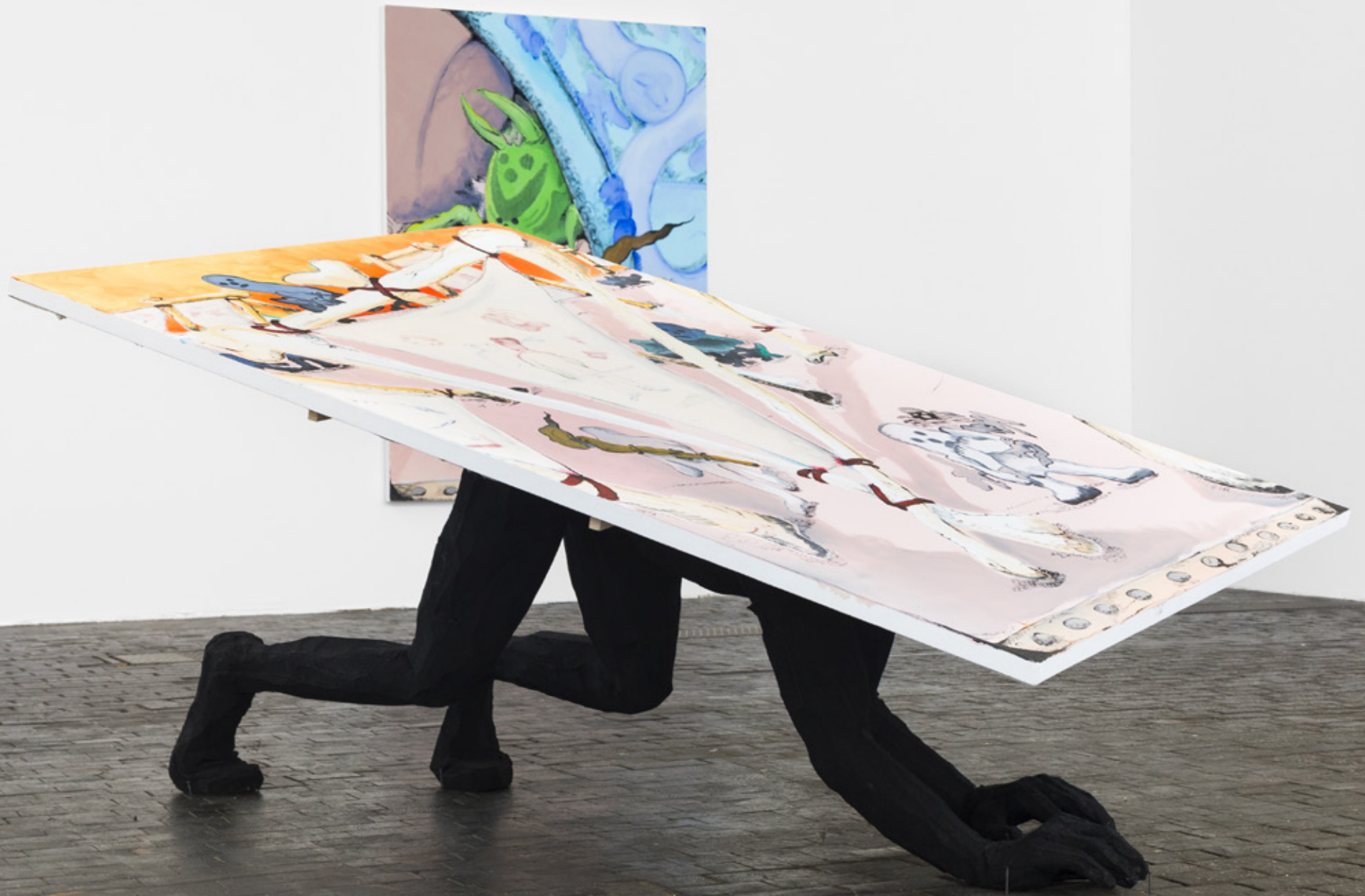
L'Homme de peinture : 120x180x100cm, métal, mousse polyuréthane et toile. 2019