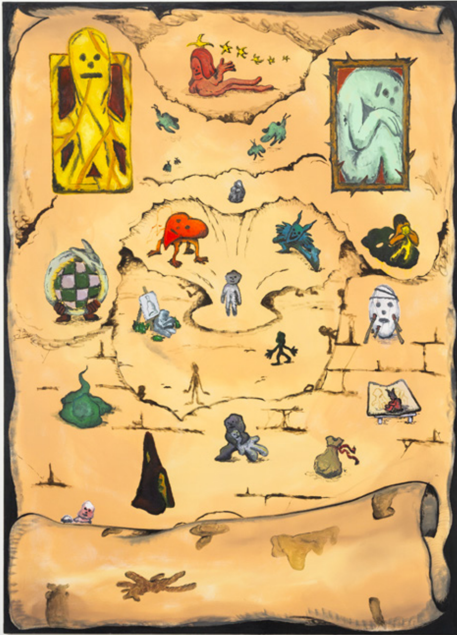
Grand parchemin de vie : 130x180cm, huile. 2020