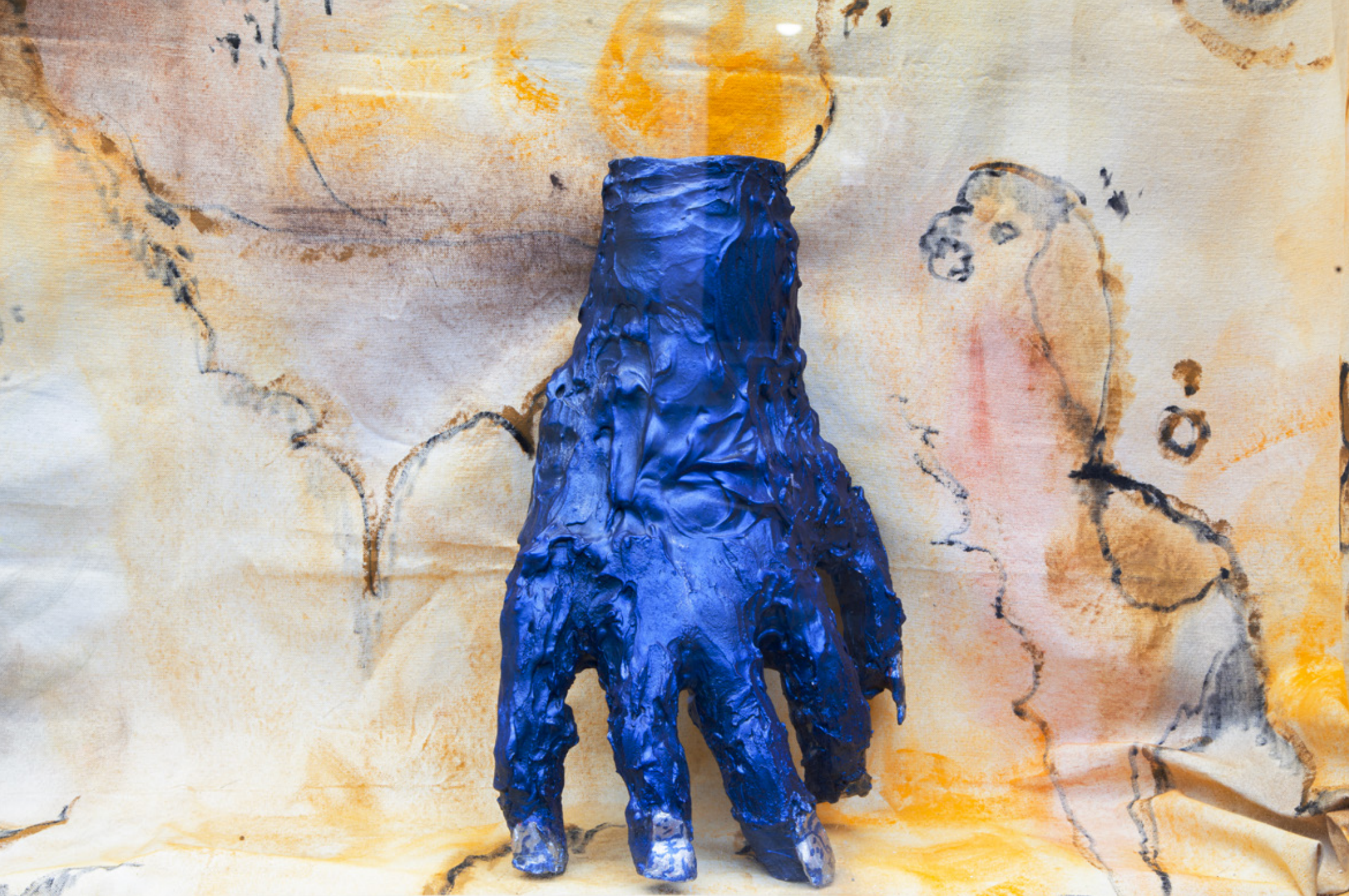
Candy Chose: Céramique et toile. Flamme Atelier, Paris. 2021