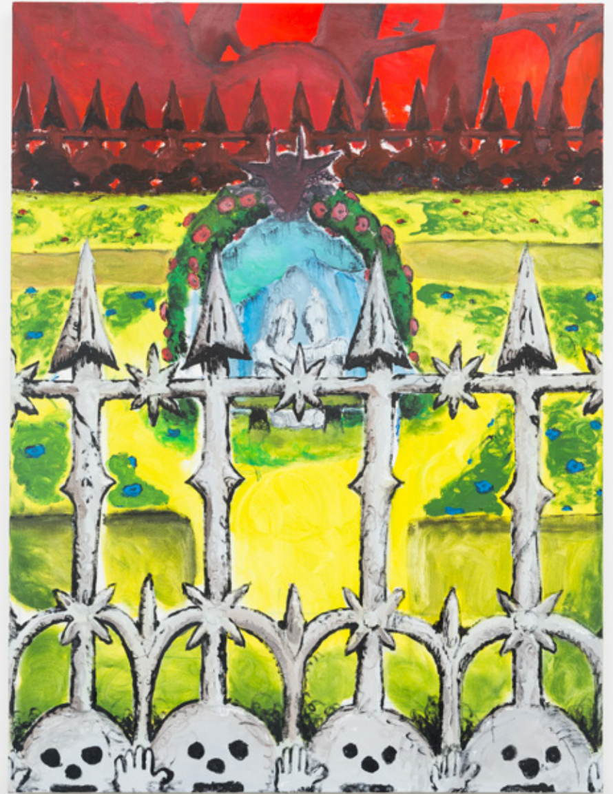
Le ciel des grilles : 90x120cm, huile. 2020