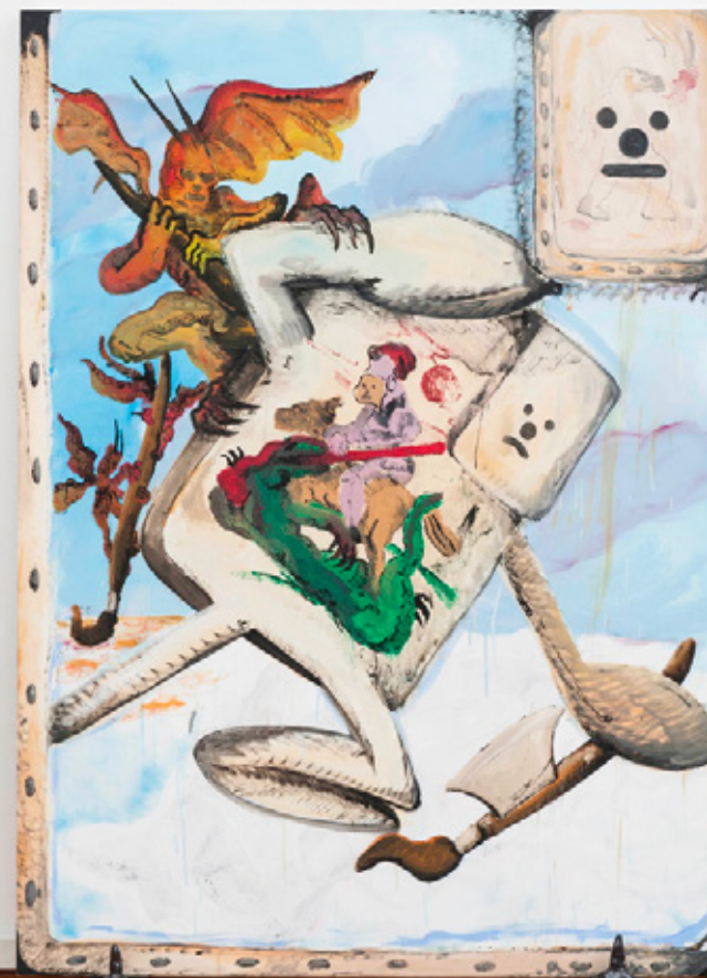
Kill St Georges : 180x130cm, acrylique et huile. 2018