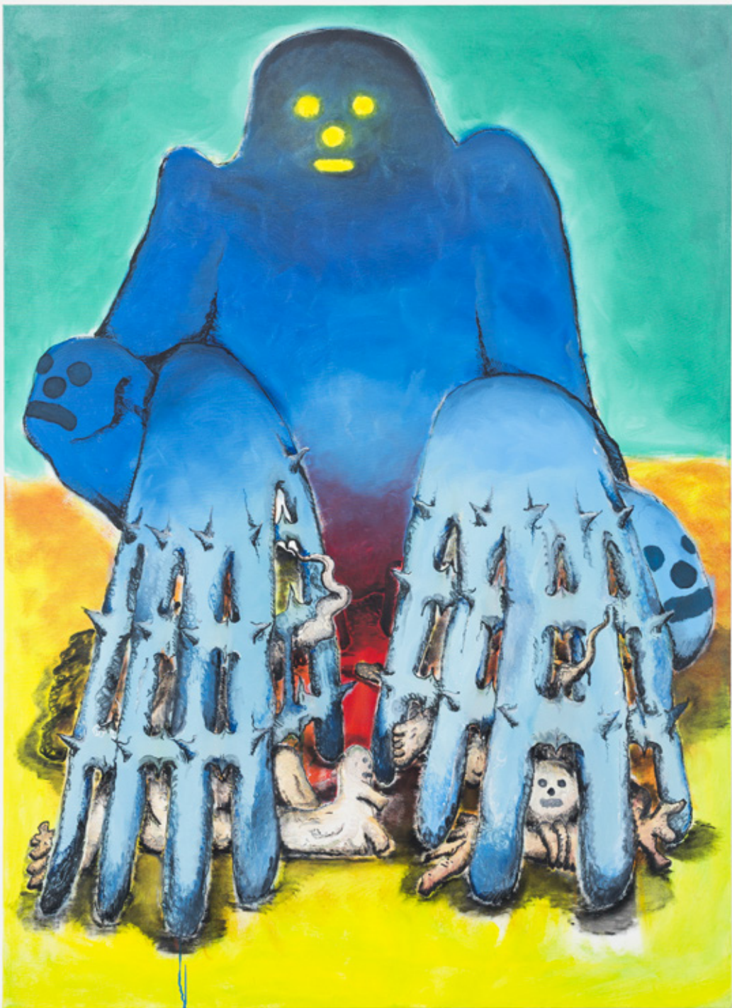
Toit paume : 130x180cm, huile. 2020